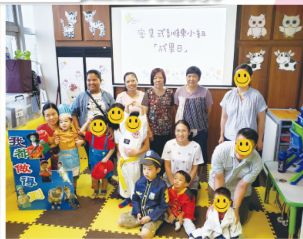
密集式訓練小組： 爸爸媽媽和我們一起參加「成果日」呀！