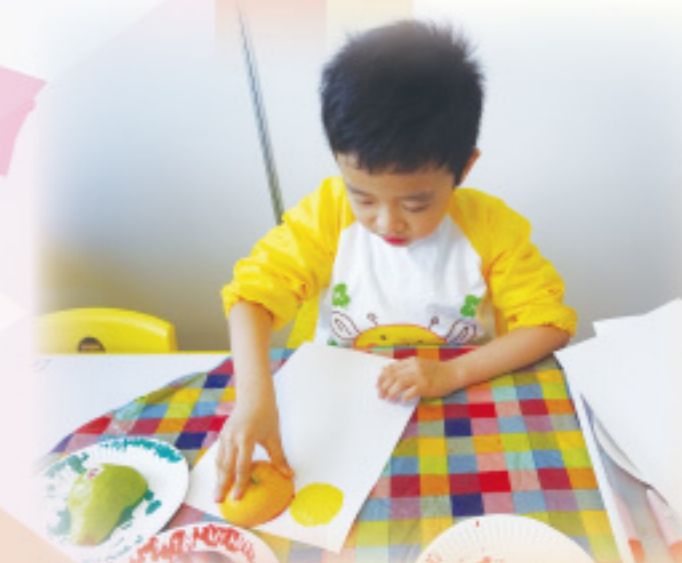
水果除了可以食之外， 還可以用來做拓印畫。