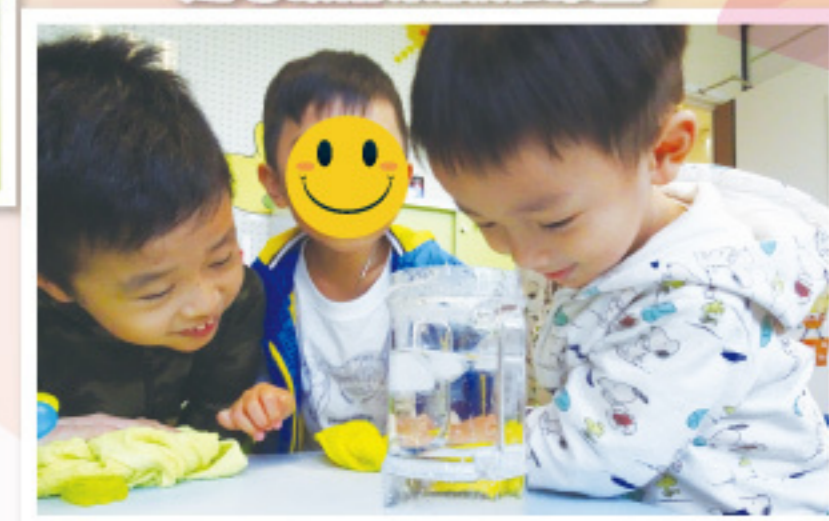
密集式訓練小組： 我們在做實驗，原來冰是會溶於熱水內。