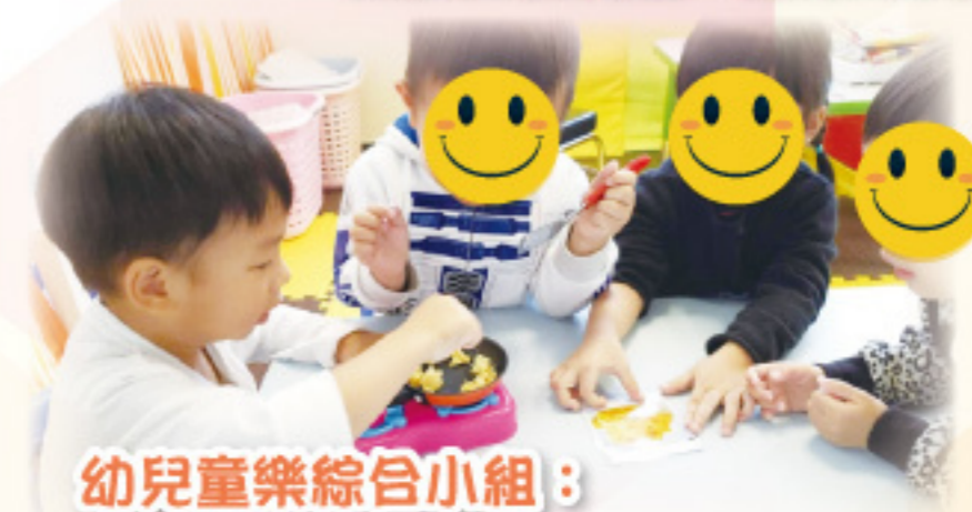
幼兒樂綜合小組： 我們一起製作炒飯！