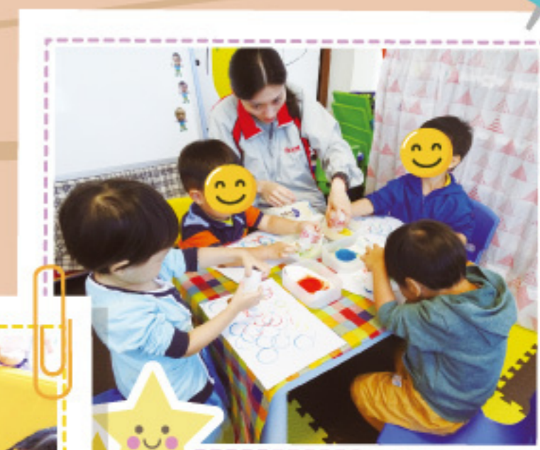
幼兒童樂綜合小組： 我們學習做圖工。