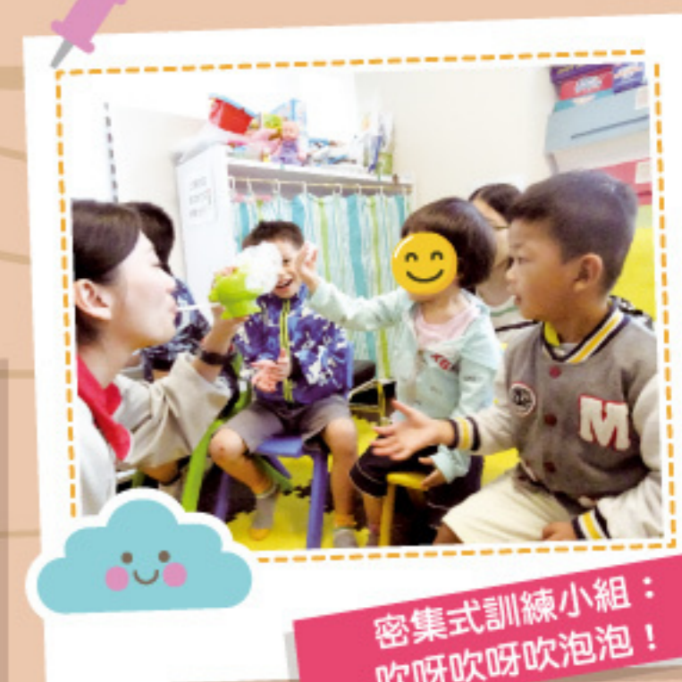
密集式訓練小組： 吹呀吹呀吹泡泡！