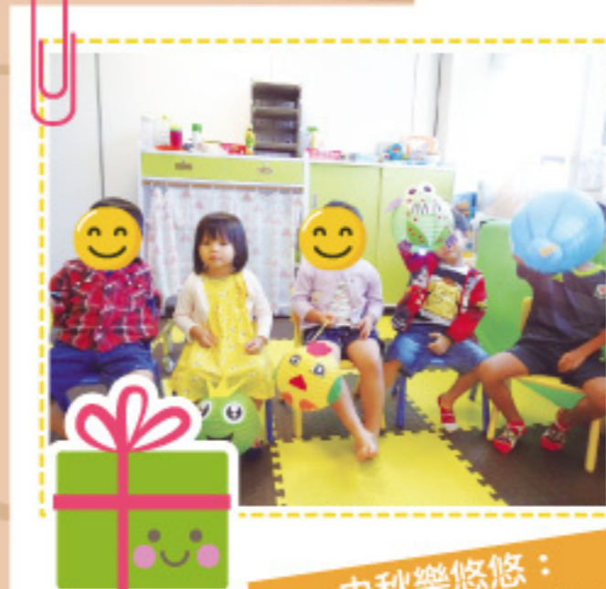
中秋樂悠悠： 我們學習自製燈籠。