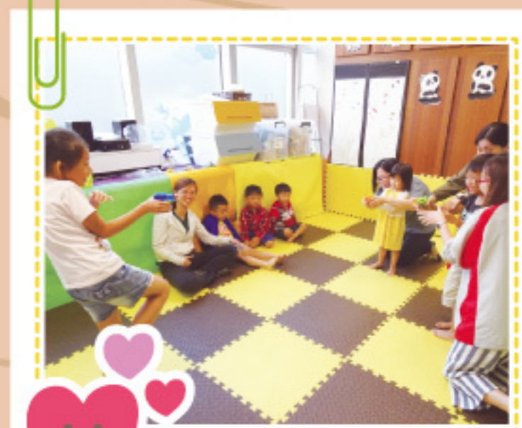
暑期樂趣多： 我們進行水戰哦！