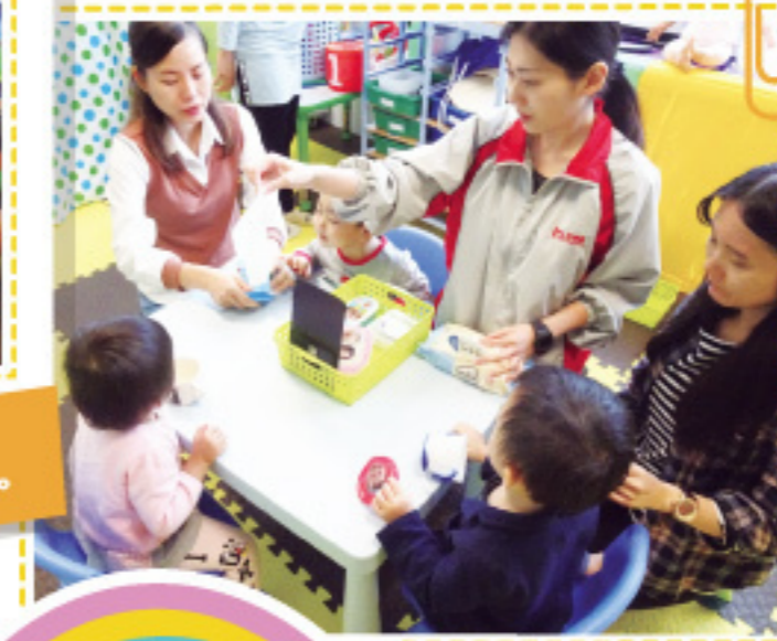
小菓子親子班： 我們學習進食前抹抹手。