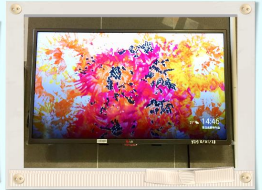
曾玉成作品 怡諾中心大堂