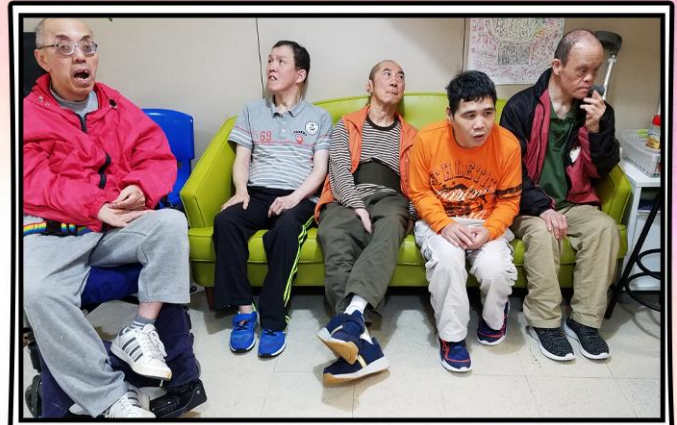
我們雖各有性格, 但我們都很喜歡結交朋友的!

中心在聖誕及新年節日期間，安排服務使用者與家人共聚天倫，讓他們和親友享受溫馨及愉快的時光。