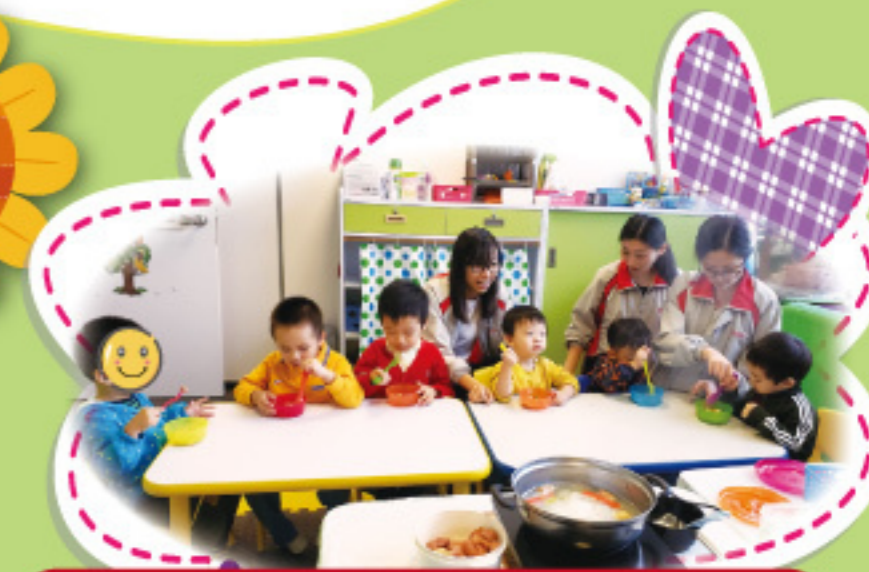
密集式訓練小組：我們一起吃火鍋。