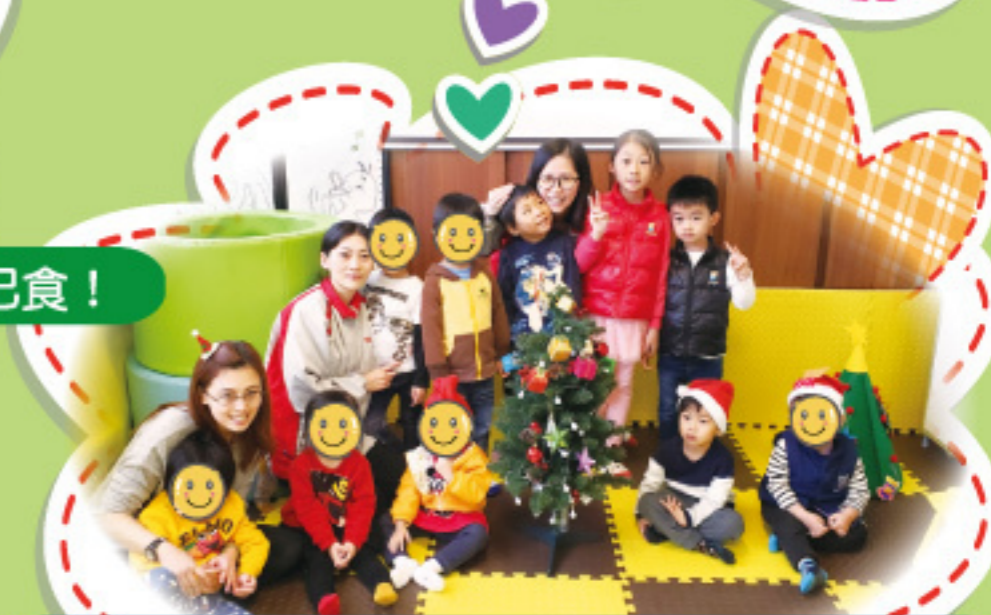
聖誕社交樂繽紛：活動後我們來一張大合照。