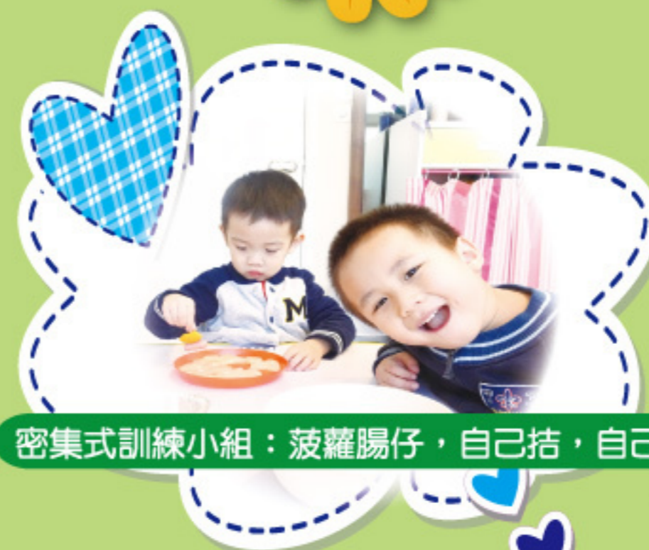
密集式訓練小組：菠蘿腸仔，自己拈，自己食！