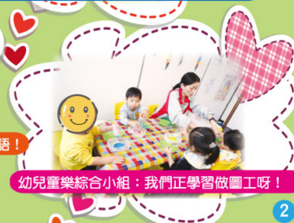
幼兒童樂綜合小組：我們正學習做圖工呀！