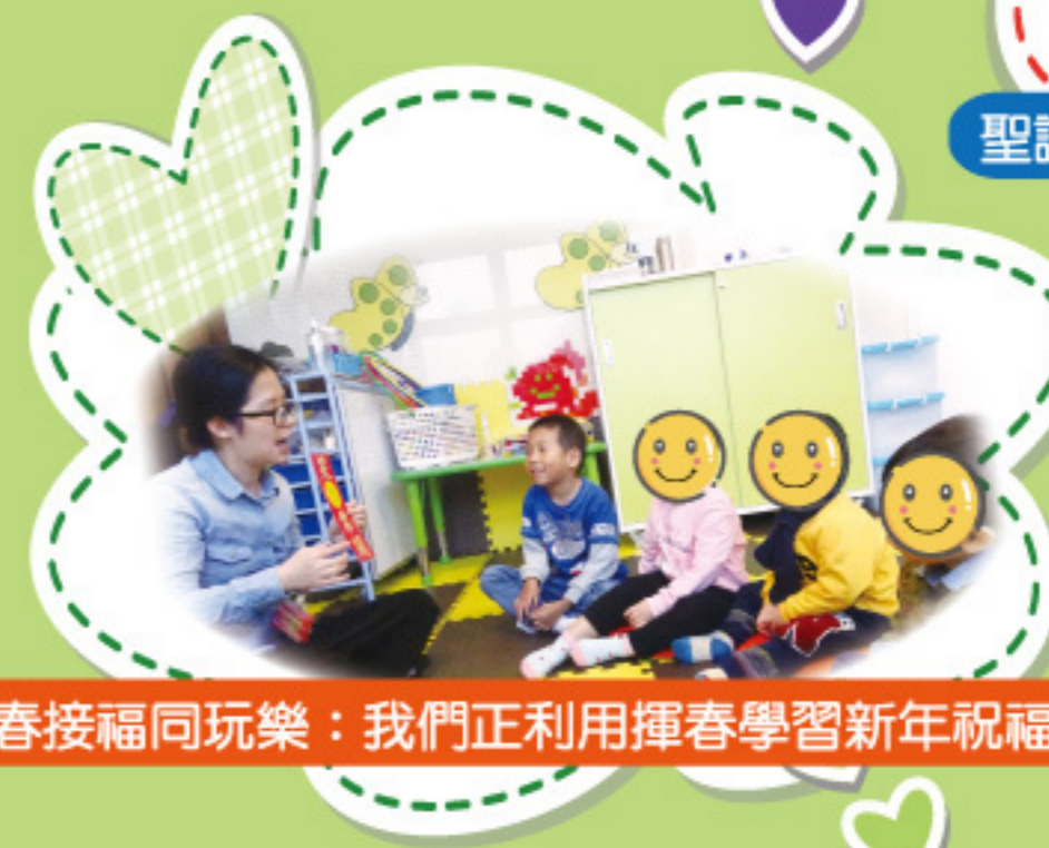
迎春接福同玩樂：我們正利用揮春學習新年祝福語！