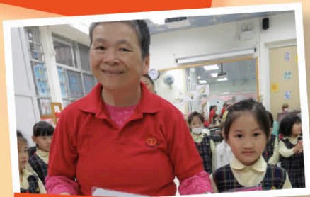
到幼稚園作社區探訪，和大家玩遊戲啊！