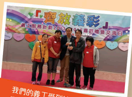
我們的義工受到社會福利署的嘉許啊！