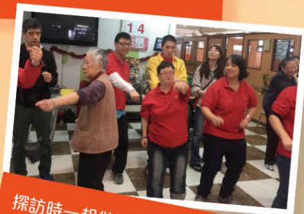
探訪時一起做運動，齊齊哈哈笑。