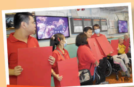
服務使用者化身義工，為長者們帶來歡樂！

我們的成員會到訪區內不同的福利服務機構、舉辦活動、送贈愛心禮物等等，將關懷帶給有需要的群體，並透過各類表演宣揚及傳達愛的訊息，積極參與社區服務（如：賣旗籌款）。以下是我們曾提供的不同服務！