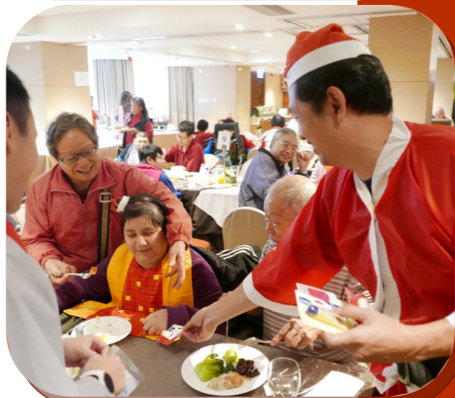
灣景國際酒店進行聖誕聯歡