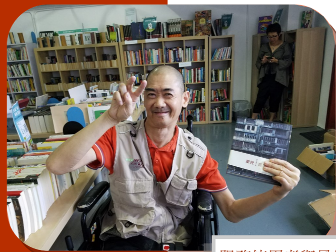
服務使用者與最佳老友一起前往非牟利二手書店選購二手書，並贈與石排灣邨的小童群益會青少年中心，增加社區學童接觸圖書的機會。