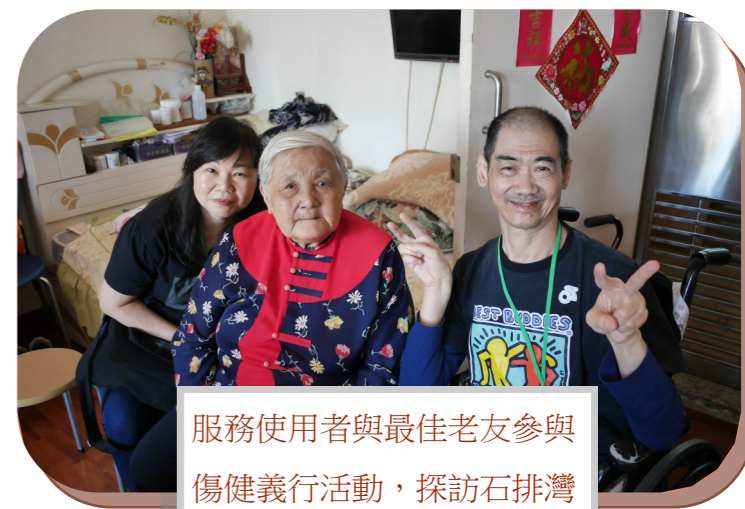
服務使用者與最佳老友參與傷健義行活動，探訪石排灣邨的獨居長者並送贈禮物，傳播愛意。