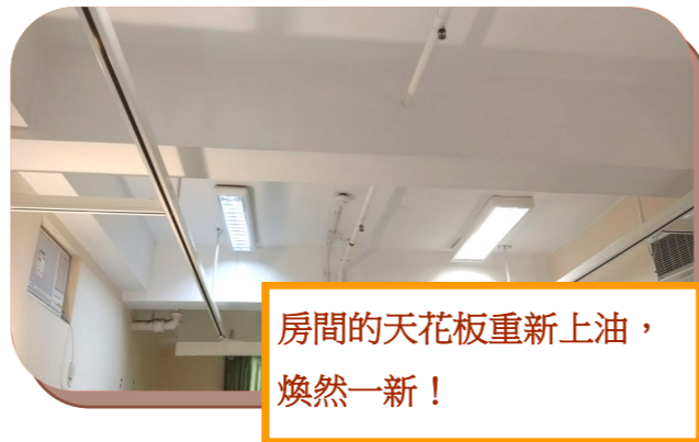
房間的天花板重新上油，煥然一新！