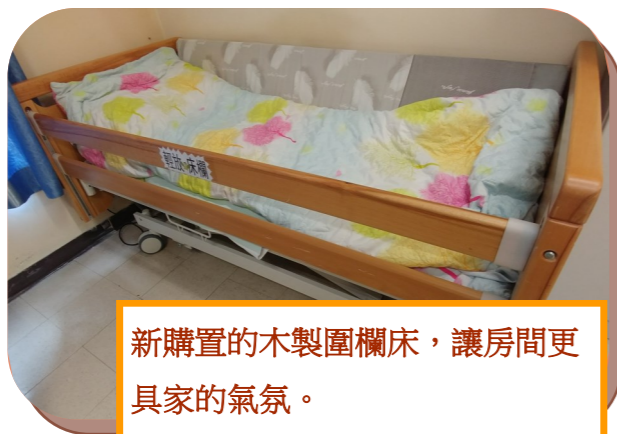
新購置的木製圍欄床，讓房間更具家的氣氛。