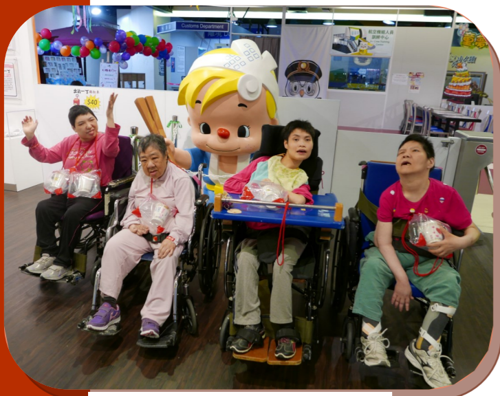
參觀機場及製作杯麵