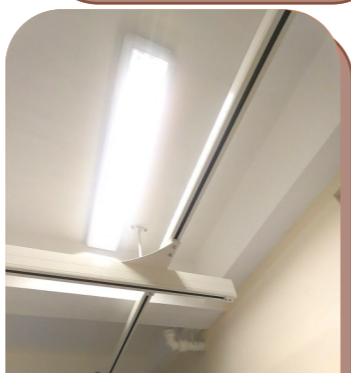
部份有需要的房間已安裝天花吊機路軌。天花吊機亦會於稍後安裝。