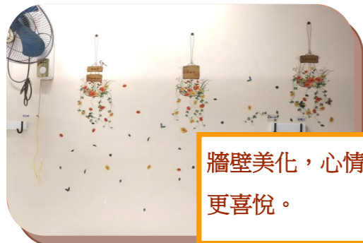
牆壁美化，心情更喜悅。