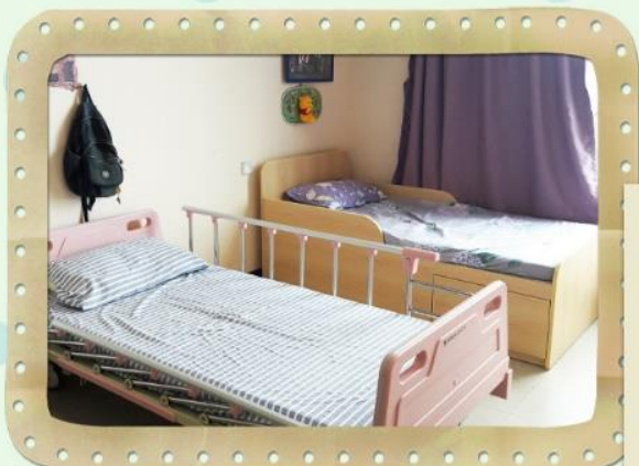
更換了新床單、枕套