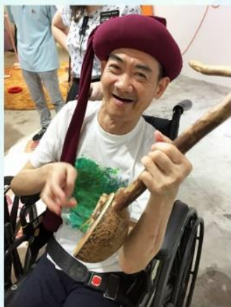
亞太無障礙藝術節